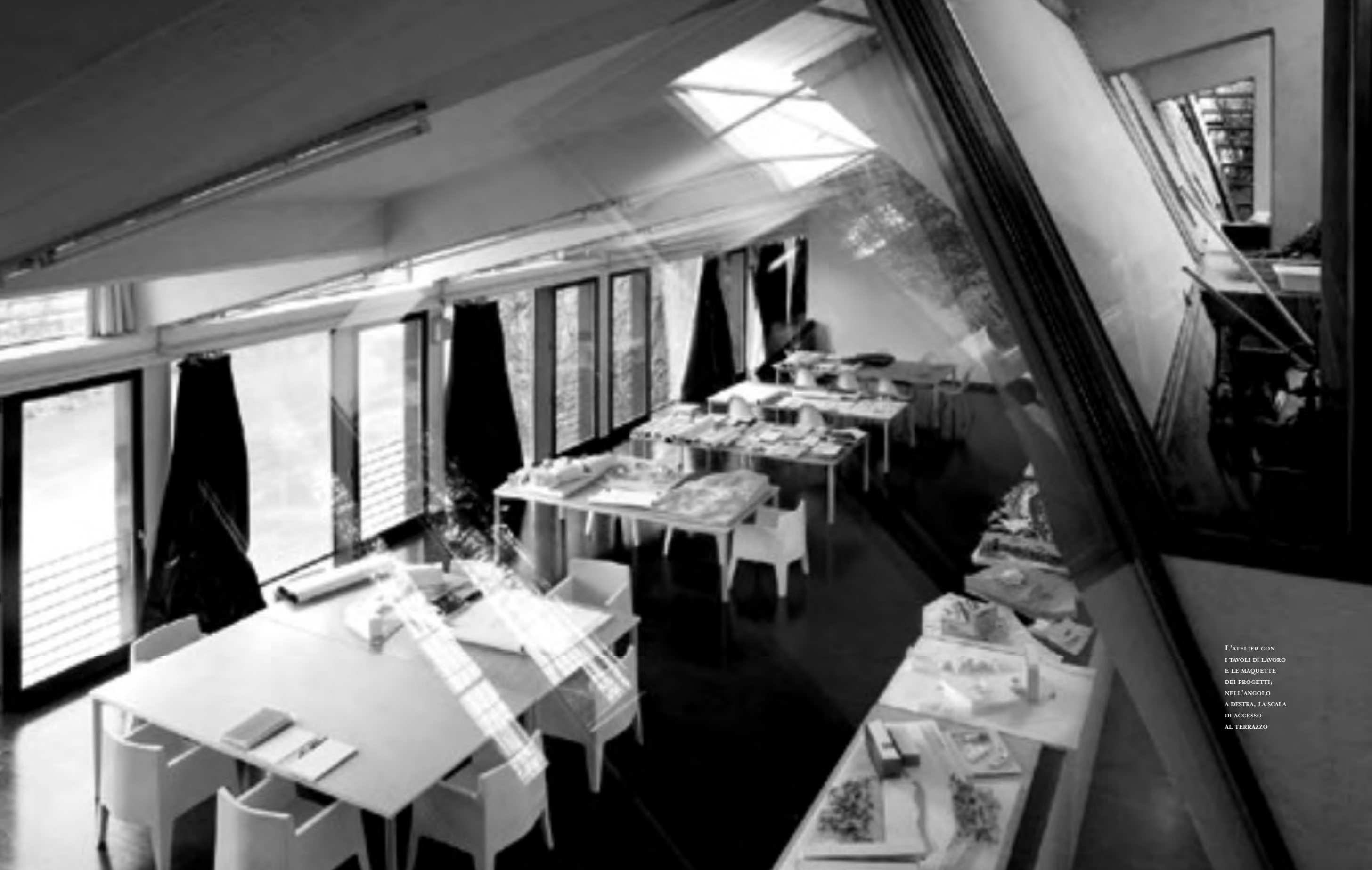
L'ATELIER CON I TAVOLI DI LAVORO E LE MAQUETTE DEI PROGETTI; NELL'ANGOLO A DESTRA, LA SCALA DI ACCESSO AL TERRAZZO