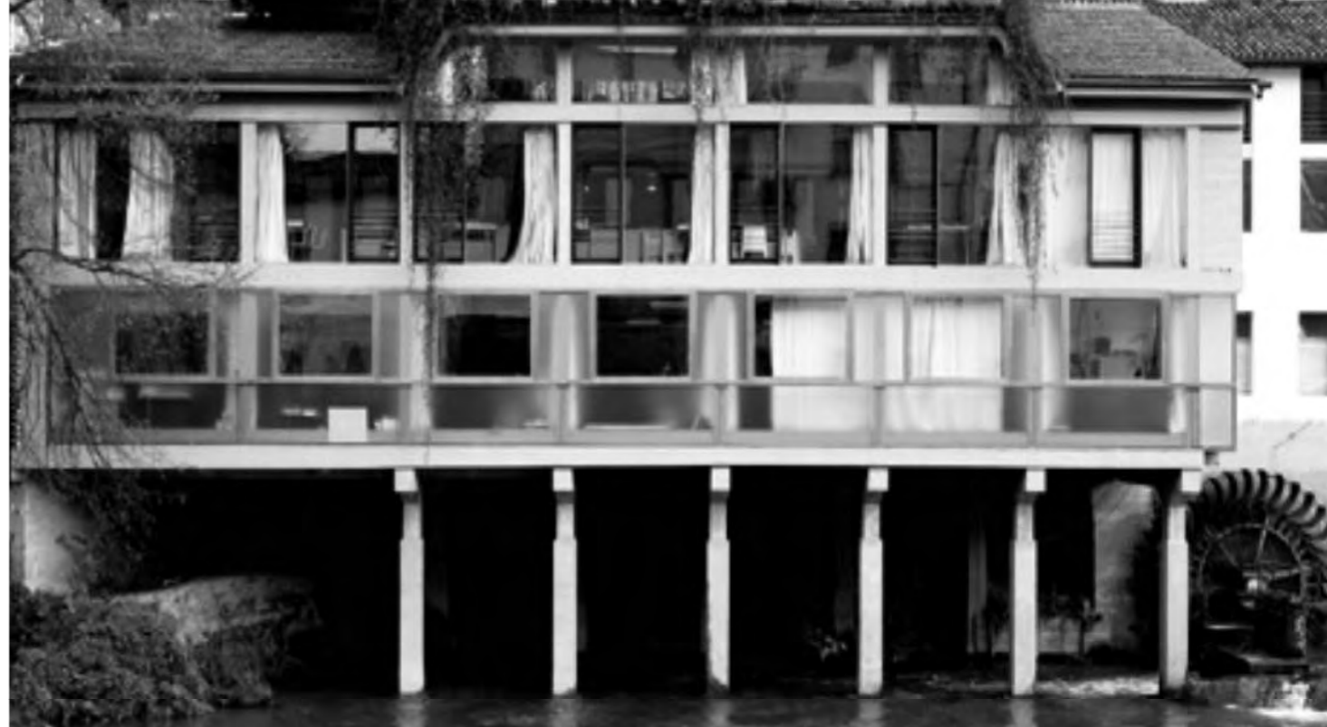
QUI SOPRA, LA FACCIATA IN VETRO E CEMENTO SUL FIUME BACCHIGLIONE. ALLA PAGINA PRECEDENTE, DETTAGLI DI UN BAGNO E DEL GARAGE

conferendo addirittura incarichi per installazioni di arte contemporanea in situ. Tuttavia, più che indugiare sui particolari, lo sguardo vaga libero e contento in questa casa ariosa e leggera, che se guardi bene è in bianco e nero, come del resto si veste il suo proprietario. Infatti: «Il mio guardaroba è grigio e le camicie soltanto bianche. I miei sarti sono Panico a Napoli, molto bravo a fare i cappotti, e Iseppi a Vicenza».